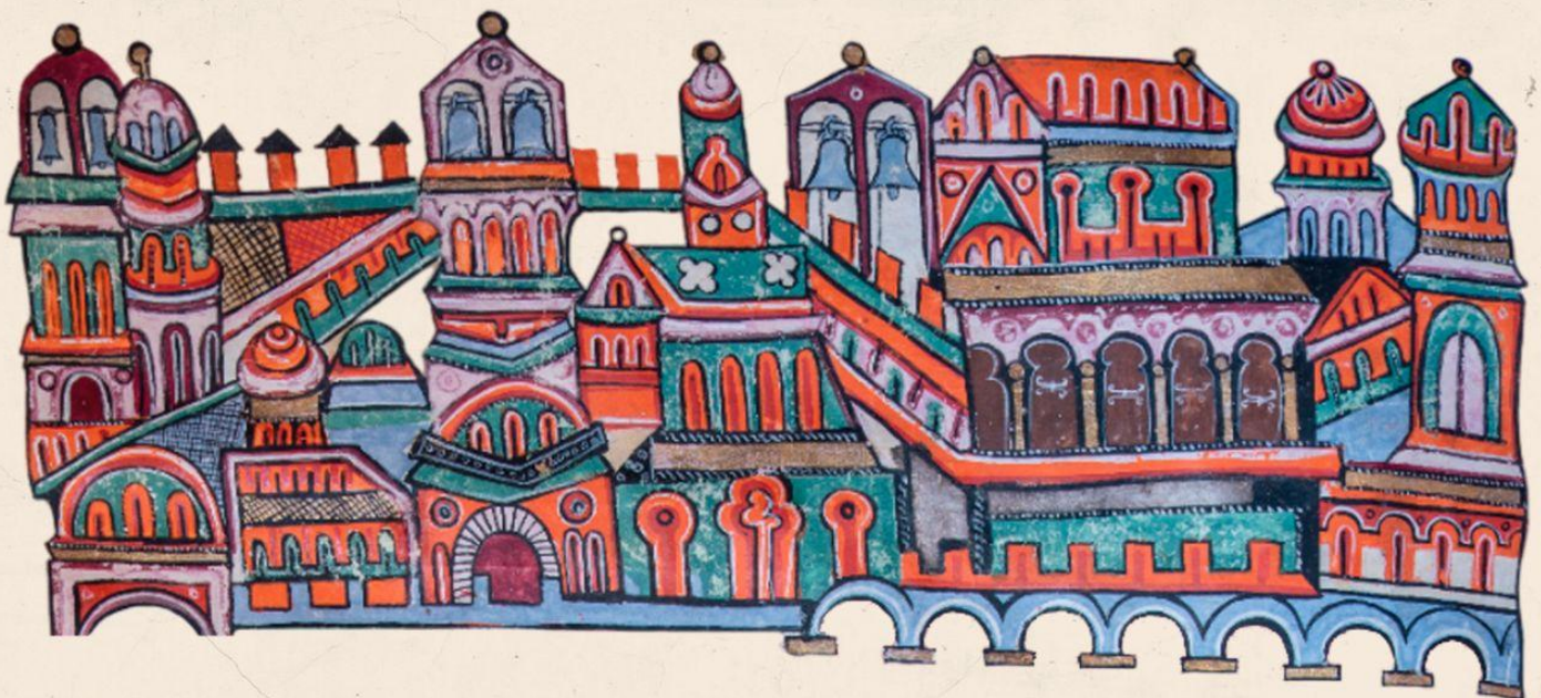
Imagen avanzada para la documentación e investigación del patrimonio cultural